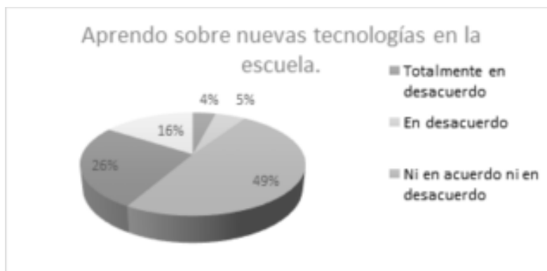
Figura 1. Uso de la tecnología en la educación.

Los estudiantes, según la encuesta realizada en general utilizan la computadora y el cañón para tareas y exposiciones en clase. Un punto interesante es que cerca de la mitad de los entrevistados no estaba en acuerdo ni en desacuerdo con el hecho de aprender nuevas tecnologías en la escuela, como lo muestra la Figura 1, lo cual puede ir ligado también al desconocimiento por parte de los profesores sobre nuevas tecnologías.