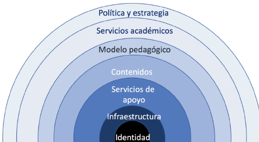
Figura 1. Estructura del modelo de referencia para la educación online.

Sobre esta base se plantea un modelo de capas (Buschmann, Meunier, Rohnert, Sommerlad & Stal, 1996) que se representa en la Figura 1.