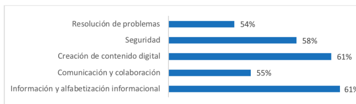
Figura 2. Uso de competencias digitales docentes.

En el área de resolución de problemas, el 54% de docentes Alguna vez comunican y resuelven problemas técnicos que han surgido en su práctica docente a través de vías de comunicación en línea. Resuelve problemas técnicos habituales en su práctica docente con la ayuda de compañeros docentes o algún tutorial o manual. Planifican y desarrollan actividades digitales para innovar su metodología docente, estableciendo un rol activo de su alumnado, y utilizan algunas estrategias para transmitir el conocimiento generado con sus estudiantes (Figura 2).