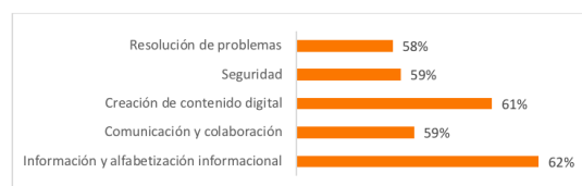
Figura 1. Conocimiento de competencias digitales docentes.

En el área resolución de problemas el 58% de los docentes conocen como resolver problemas técnicos no complejos relacionados con dispositivos y entornos digitales con la ayuda de un manual o información técnica disponible, se ofrecen para resolver problemas tecnológicos relacionados con su trabajo docente y seleccionan la solución más adecuada a las necesidades de cada momento (Figura 1).