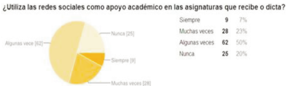
Figura 4. Utiliza las Redes Sociales como apoyo académico.

Es aquí el punto que tanto las instituciones educativas como los docentes que pertenecen a ellas, deben aprovechar para orientar a los jóvenes sobre el aprovechamiento de las redes sociales, no sólo con fines sociales y de entretenimiento sino en una implementación de carácter educativo. Nos apoyamos además en que, para la mayoría, las redes sociales como tal, son importantes y, en la respuesta que nos ofrecen cuando un 80% indican que siempre, muchas veces y algunas veces la utilizan como apoyo académico como se puede apreciar en a figura 4.