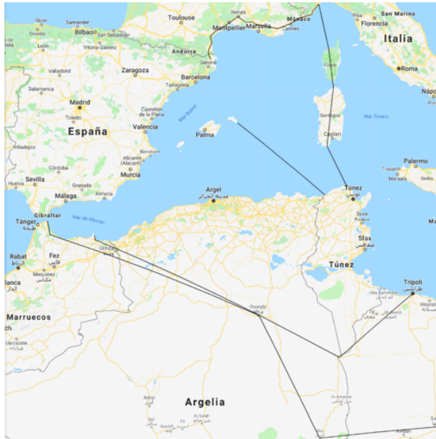
Figura 3. Posibles vías de entrada en España de los combatientes españoles de Daesh en Libia. Fuente: Elaboración propia.

Todas estas posibles vías de entrada en España de los combatientes españoles de Daesh en Libia se pueden observar en la Figura 3.